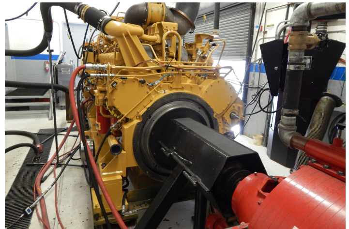
Prueba de dinamómetro