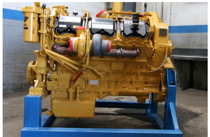
Motor C27 StaTerra Power™