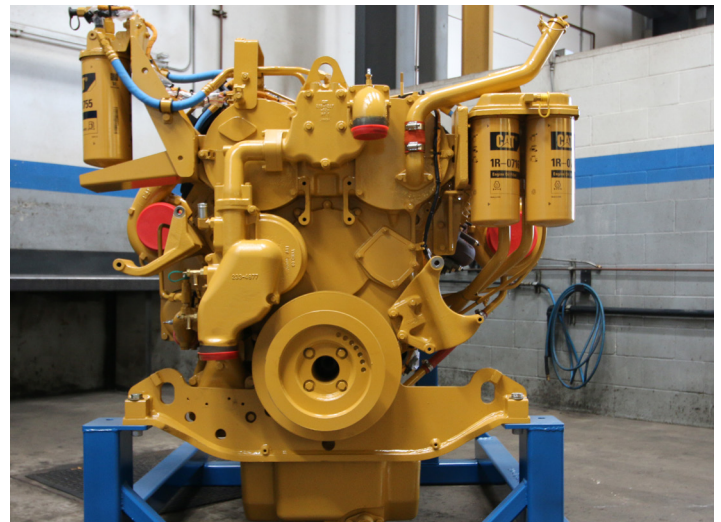
Motor C27 StaTerra Power™

Las piezas de repuesto H-E Parts son compatibles con las marcas y/o modelos de equipos externos descritos. H-E Parts International no es un centro de reparación autorizado de estos equipos externos y no tiene afiliación con ningún fabricante de estos productos externos. Todas las marcas, fabricantes de equipos originales (OEM), números de partes o referencias son propiedad de las respectivas entidades OEM o sus afiliados. Estos términos son utilizados por H-E Parts International para identificación y referencias cruzadas únicamente y no tienen la intención de indicar afiliación o aprobación por parte de OEM, de H-E Parts International o sus productos.